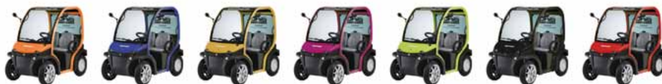
Arancio Metal Metal Orange